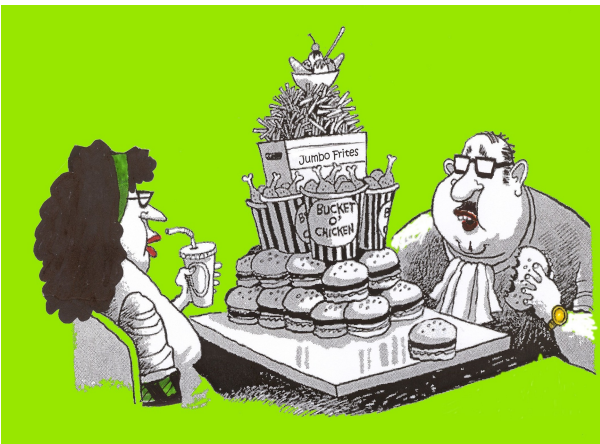
The American „Food Pyramid“

Wir reden über die Nahrungsmittelpyramide!